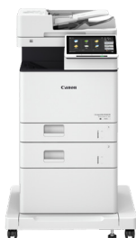
iR ADV DX 717/617/527